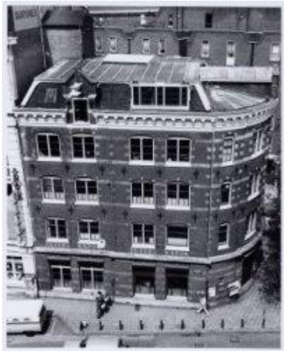
N. V. Peters Kapokfabrieken in 1979

Toch kreeg de onderneming toestemming om haar activiteiten aan de Nieuwezijds Voorburgwal 2 voor te zetten.